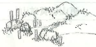
「蝦夷日誌」松浦武四郎 弘化4年(1847)