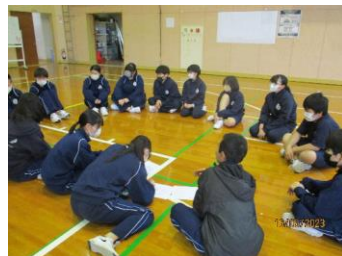
体育祭チームミーティング

「自ら学び、行動し、自らを磨き高める生徒の育成」という重点教育目標に改訂して、2年目に入りました。昨年度のさまざまな取り組みの中で、生徒は着実に「自ら…」を実行しつつあると実感しています。5月の体育祭や9月の恵祭を初めとした行事や日常の授業の中で、話し合いなどの協働的な学びを通して、生徒の自主的な取り組みが随所に見られ、